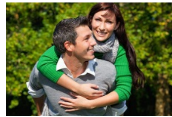
Partnersuche in Frankfurt!

Partnersuche in Frankfurt, ob Singles in der Umgebung oder direkt in Frankfurt gesucht werden, die Möglichkeiten zum Erfolg können vielseitig sein. Meist sind auch Faktoren wie die persönliche Fähigkeit mit Menschen umzugehen sehr von Bedeutung. Ein sehr schüchterner Mann wird auf der Straße oder Disko nicht ohne größere Schwierigkeiten eine Frau ansprechen können, dadurch wird wahrscheinlich dann auch kein gutes Gespräch daraus kommen. Für schüchterne Menschen, ist das Internet wohl ein optimaler Ort, um sich auf Partnersuche zu begeben.